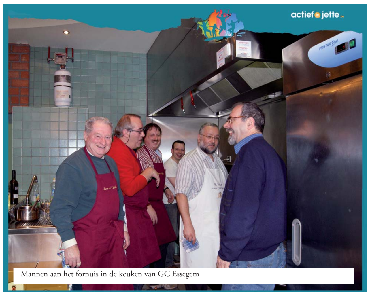
Mannen aan het fornuis in de keuken van GC Essegem