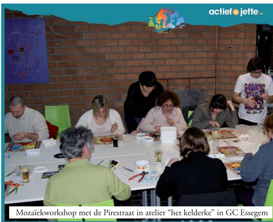
Mozaïekworkshop met de Pirestraat in atelier "het kelderke" in GC Essegem