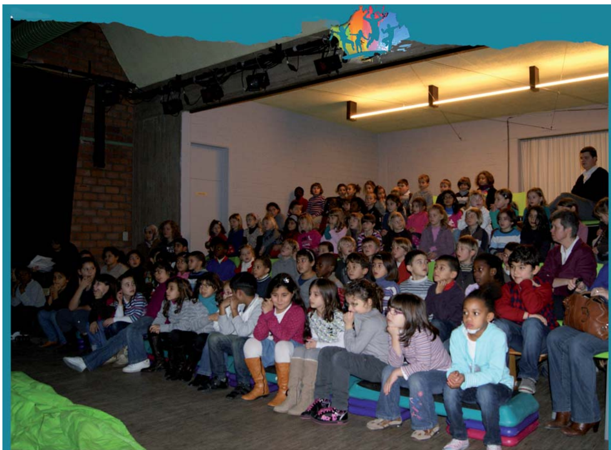
Theatervoorstelling "Lievebeestheertjes" voor 3de kleuterklas en 1ste en 2de leerjaar van de Jetse basisscholen

doorheen de geschiedenis en alle leeftijden. Iedereen kan kunst maken, er is niet enkel plaats voor kunst met de grote K. Dat bewijst het artiestenparcours eens te meer. Het is bovendien een manier om kunst dicht bij de mensen te brengen. En natuurlijk een uitstekende manier om je burenen te leren kennen. De stoepstenen en Javier's werk zijn vanaf 2 april te bewonderen in de Fernand Pirestraat te Jette. Dit is tevens de start van het artiestenparcours. Meer info kan je vinden op www.artiestenparcoursartistes.be voor alle nationaliteiten